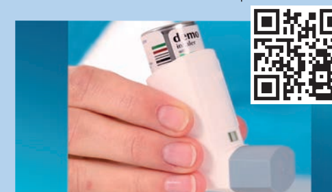
Dosier-Aerosol mit Zählwerk