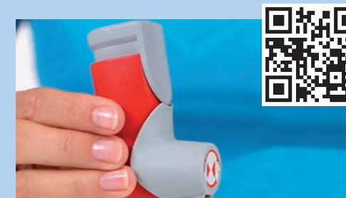
Dosier-Aerosol mit Dosiszähler und Schutzkappensicherung