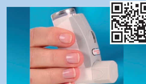
Dosier-Aerosol mit Zählwerk und Ampelfunktion